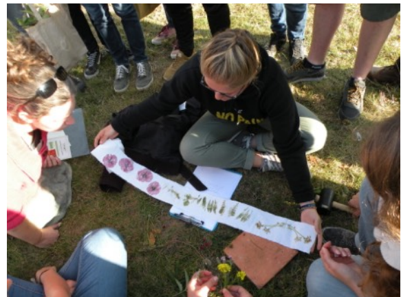
Découverte des plantes sauvages colorantes